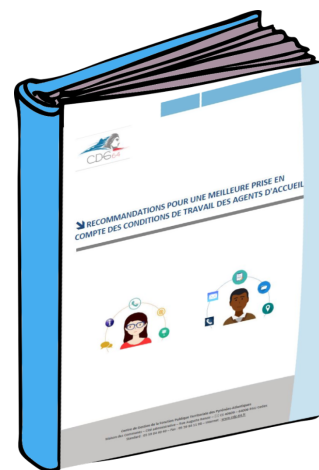
Livret agent d'accueil

Vous y trouverez des informations sur la gestion des ressources humaines , l' aménagement et l'organisation du poste , la prévention des risques professionnels ainsi qu'un zoom sur la gestion du risque agression